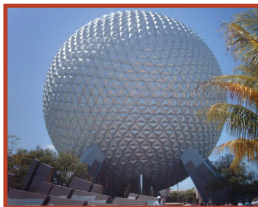
Geosphere, Epcot Center - Florida Buckminster Fuller