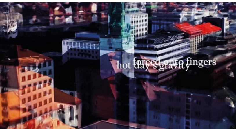
Alinta Krauth Machinemenomenology (nr. 1)