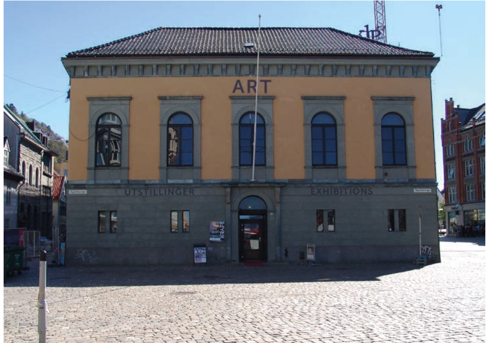
3.14: Vågsallmenningen 12, 5014 Bergen

3.14 promoterer mangfold og fremmer aspekter ved den kompleksitet som preger dagens kultursituasjon og samfunn. Vi fremmer kultur på tvers av kulturskiller.